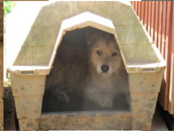
Harry und Mimis im Tierheim in Nerokouro

Harry und Mimis werden in Hamburg auf dem Flughafen abgeholt