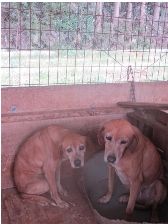
Sara (links die Kleinere), Zeny (rechts)

Diese beiden Hunde wurden im Jahr 2008 in einem Karton vor dem Tierheim abgestellt. Sie waren damals ca. 2 Monate alt. Als sie 6 Monate alt waren, wurden sie von einer griechischen Familie übernommen. In dieser Zeit ging es ihnen – nach griechischen Verhältnissen – gut. Als sie 9 Monate alt waren, hat die Familie die Hunde zurück gebracht. Sie haben sie am Abend beim Tierheim im Freigelände / Bambushain einfach ausgesetzt. Die Hunde haben sich in dem doch recht großen Gelände versteckt, Costoula und die Arbeiter konnten sie aber nicht einfangen. Sie wurden von Costoula versorgt.