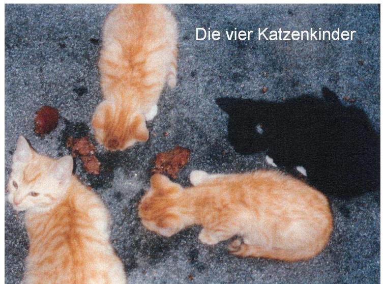
Die vier Katzenkinder

Drei Wochen später rief meine Nachbarin mich an: Jule hat vier zauberhafte Kinder, drei rote, ein schwarzweißes. Jule hatte eine harte Zeit. Wann immer sie beim Fressen ein größeres Stück erwischte, hielt sie es zwischen den Zähnen, sprang damit von der Fensterbank aufs Vordach und über die Balkonbrüstung zu ihren Kindern, unermüdlich und hunderte Male. Sie sah erschöpft uns ausgelaugt aus. Mit Katzenmilch, Thunfisch, gedünstetem Dorsch und Leberwurst hab ich Julchen aufgepäppelt. Die Welpen konnten die Balkonbrüstung noch nicht überwinden.